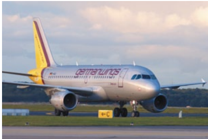
Die in Köln/Bonn ansässige Airline Germanwings will im Falle der Einführung der „Ökologischen Luftverkehrsabgabe“ nach Maastricht/NL wechseln.